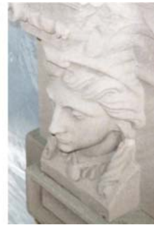
Naturstein - Büste vor und nach der Reinigung mit der SAPI Mini-Wirbelstrahltechnik

Weitere Informationen zu unserem kompletten Produktprogramm erhalten Sie über unsere