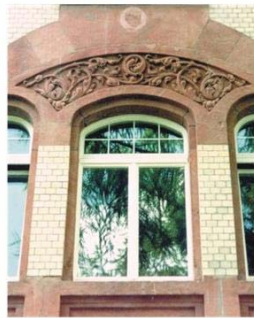
Fenstergewänder vor und nach der Reinigungsmaßnahme mit der SAPI „VARIO“ Wirbelstrahltechnik