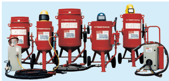
SAPI „VARIO“ Niederdruck – Schonstrahlgeräte in verschiedenen Größen und technischen Ausstattungen.

Die Druckstrahl - Geräte gibt es in den unterschiedlichsten technischen Ausstattungen und Größen je nach Einsatz- und Anwendungsgebieten. Die Schonstrahlgeräte finden ihren Einsatz bei kleinen Restaurierungsarbeiten bis hin zur großflächigen Fassadenreinigung. Hier haben sich die Strahlgerätegrößen von 18, 28, 60 und 100 ltr. bewährt. Außerdem verfügen die Geräte über modernste sichere Abschalttechniken, die es in pneumatischer als auch in elektropneumatischer Ausführung gibt. Alle Druckstrahl-Geräte sind TÜV – zertifiziert und gewährleisten somit höchste technische Standards und Sicherheit für den Anwender.