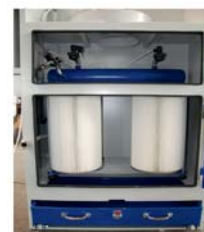
Integrierte Absaugung mit Patronenfilter 0,75 KW mit Staubschublade