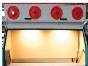
Strahlraum mit Frontklappe, Gitterrost, Innenraumbeleuchtung, Strahldüse und Luftausblaspistole