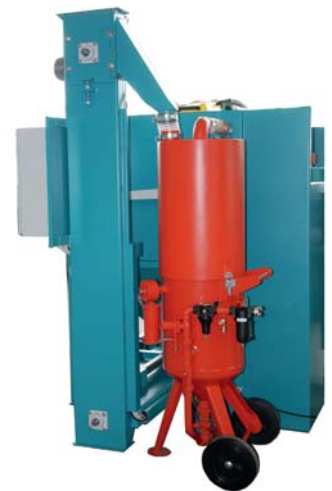
Pressure blasting unit with Blasting material cyclone separator

Siemens SPS control, Re-fitting for additional functions, very economic