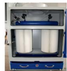
Integrated suction with cartridge filter 0,75 kW with dust drawer