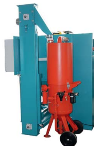
Druckstrahlgerät mit Strahlmittel Zyklonabscheider

Siemens SPS Steuerung, Nachrüstung für zusätzliche automatische Funktionen, sehr kostengünstig!